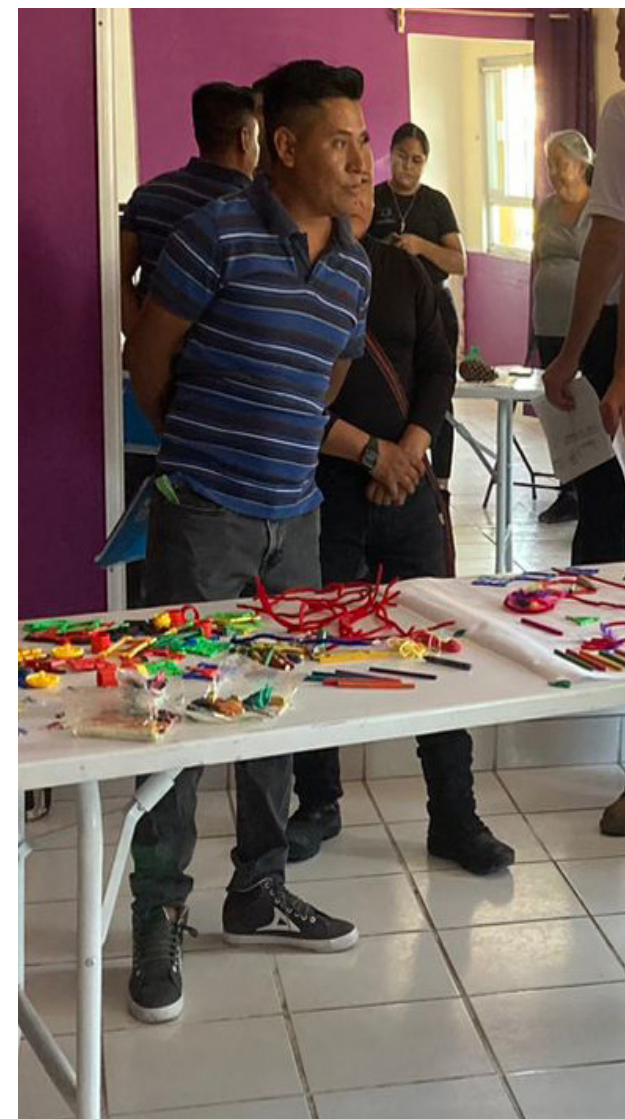
Comunalia, 2024, Fundación Comunitaria

Las sesiones sobre métodos cuantitativos hicieron énfasis en su importancia para generar evidencia que informe los proyectos en sus diferentes fases (diagnóstico, diseño, identificación de alternativas, seguimiento a partir de indicadores, evaluación y aprendizaje). Se analizó también el uso de los resultados del análisis cuantitativo para tomar