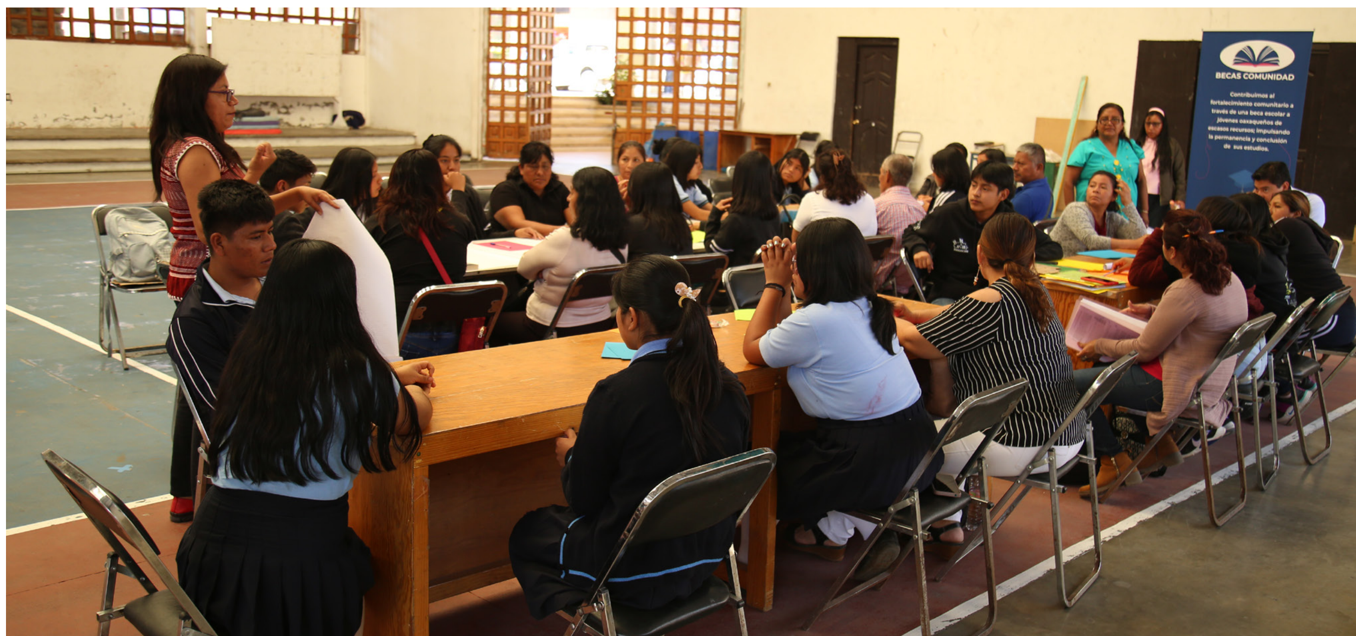
Comunalia, 2024, Oaxaca