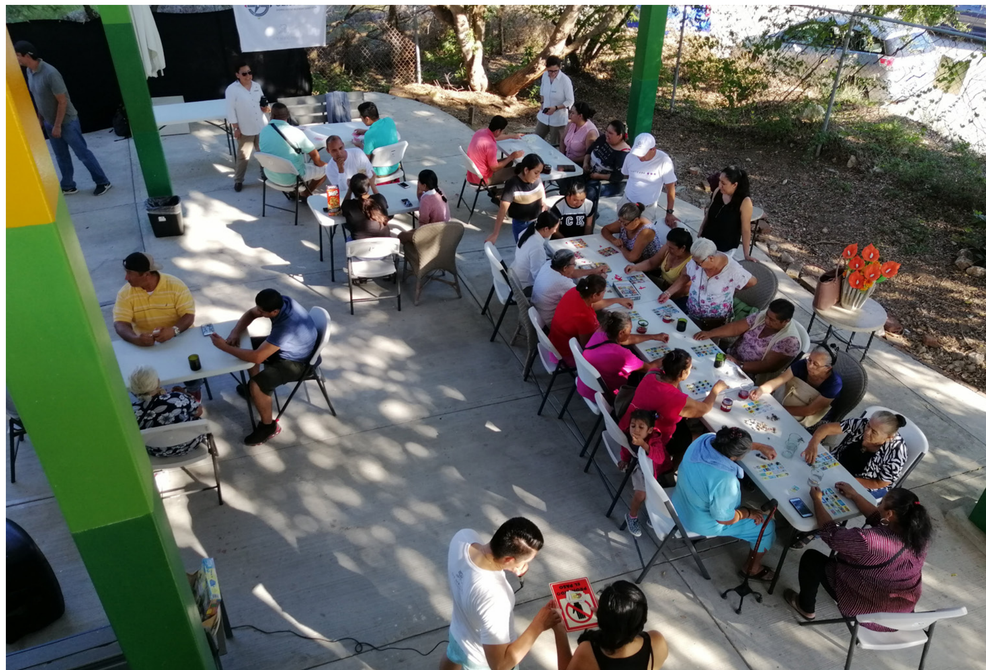
Comunalia, 2024, Fundación Punta Mita

Como parte de su compromiso con el fortalecimiento de las fundaciones comunitarias de México, Comunalia en el 2021 inició la formación de miembros de la alianza en Signos Vitales. Este es un programa desarrollado por las fundaciones comunitarias de Canadá que promueve el uso de información local y de fuentes estadísticas nacionales o regionales para medir los “signos vitales” de las comunidades y desarrollar programas basados en evidencia y soluciones localmente relevantes que contribuyan a mejorar la calidad de vida en los territorios.