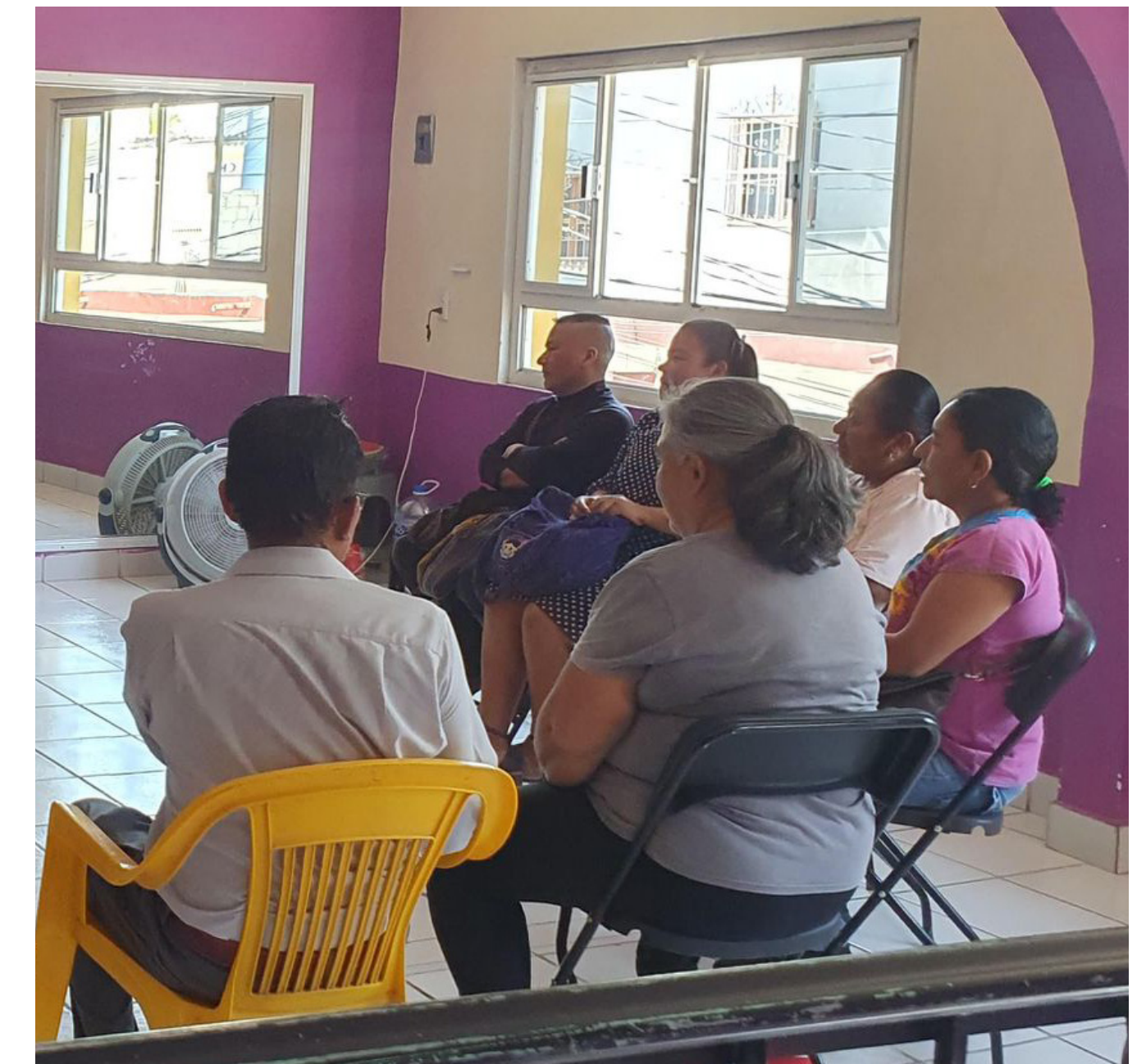
Comunalia, 2024, Fundación Comunitaria Comunidad

realizados por las diferentes organizaciones y redes en los temas priorizados por Signos Vitales (seguridad alimentaria y empleabilidad), pero buscará fortalecer la colaboración entre ellos y una mayor vinculación con los ODS. Como dice su directora ejecutiva en la introducción del reporte: