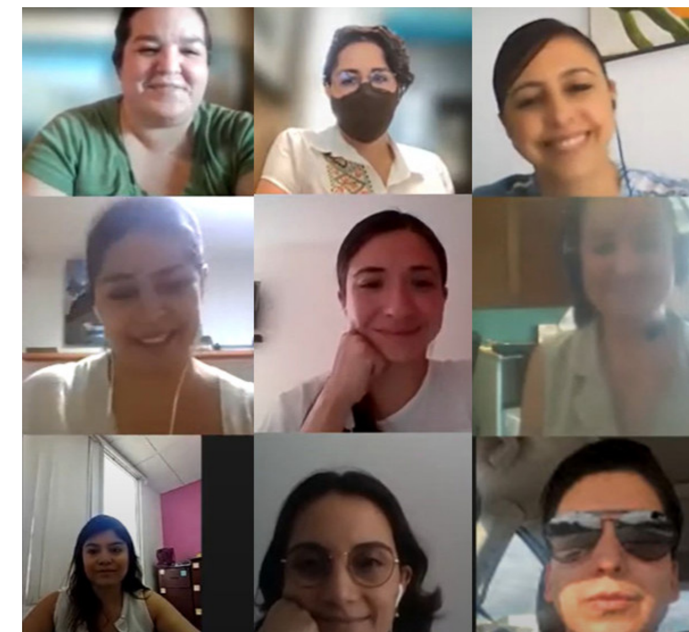
Comunalia, 2022, Bienvenida Virtual Signos Vitales

En el 2021 la etapa formativa se realizó antes de los procesos de investigación. En el 2022 y 2023, gracias a que se contaba con las grabaciones de los contenidos de formación de la primera impartición, estos pudieron entregarse a los participantes para que los estudiarán a su propio ritmo y las reuniones grupales se centraron en compartir experiencias y resolver preguntas sobre los desafíos que se iban presentando durante el proceso institucional de preparación de la investigación o en la misma investigación. 12