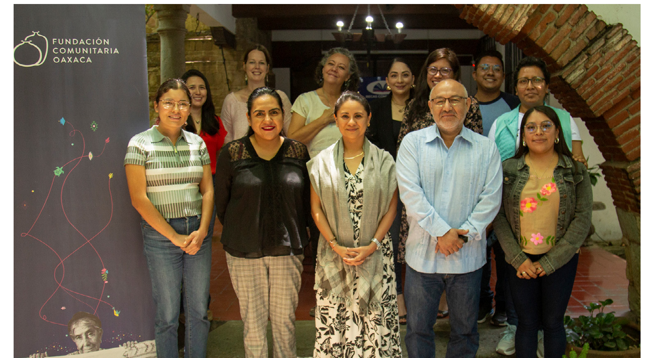
Comunalía, 2024, Fundación Comunitaria Oaxaca

En este caso se describe el programa de Signos Vitales, sus componentes, el papel de Comunalía para promoverlo entre sus miembros y el proceso de fortalecimiento de capacidades para llevarlo a cabo, así como los resultados de la iniciativa.