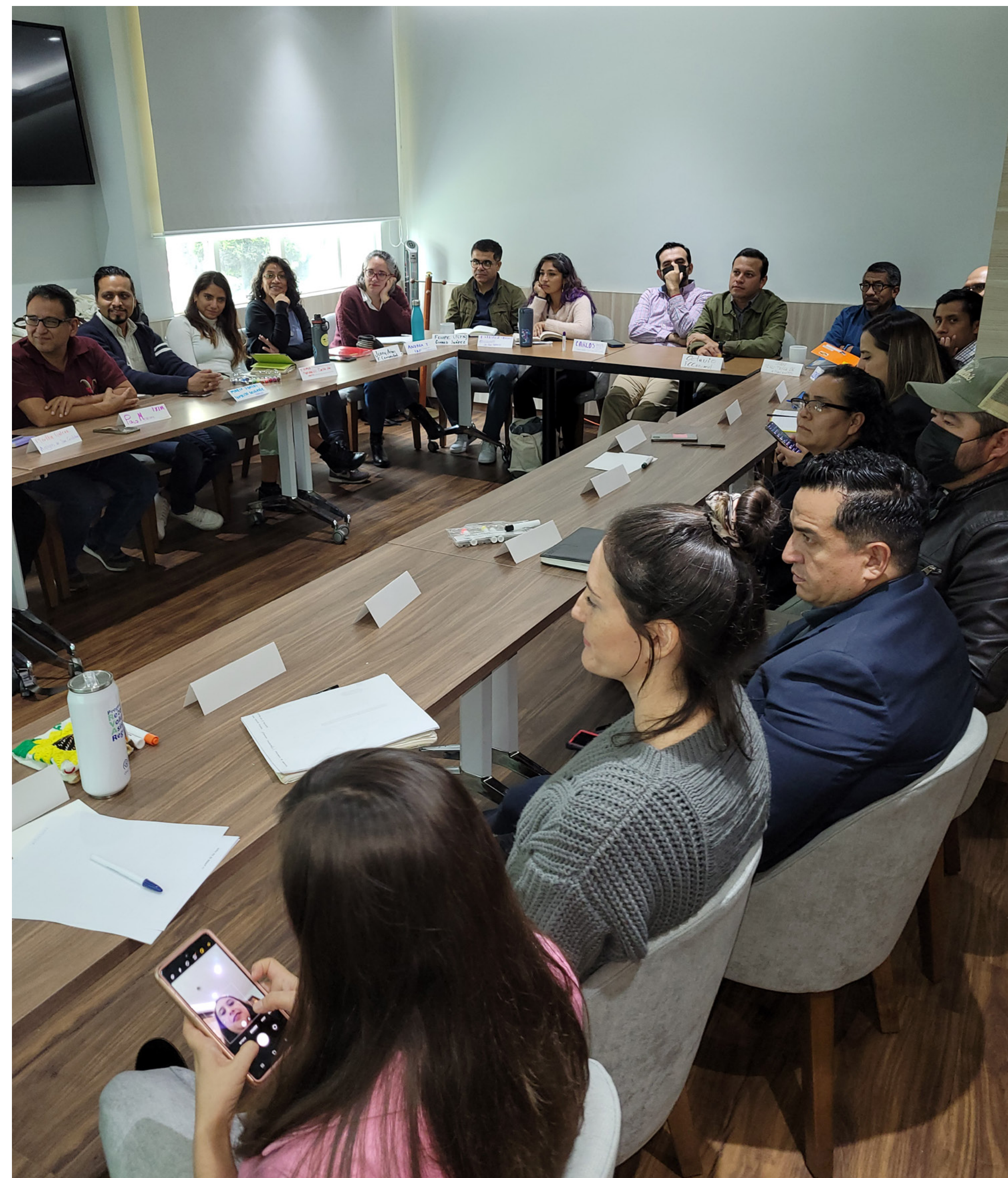
Comunalía, 2024, Fondo Comunidades Activas