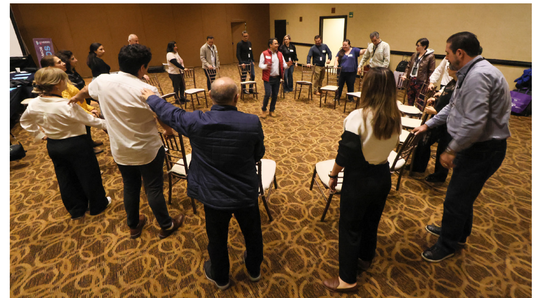
Comunalía, 2022, Asamblea Comunalía

Otro tema tratado en la sesión introductoria fue la plataforma creada por Comunalía. Esta plataforma cuenta con recursos que pueden ser consultados por las participantes en cualquier momento para mejorar los procesos de implementación del programa. Entre los recursos se encuentran el Manual de Signos Vitales, lineamientos para los reportes y ejemplos de reportes nacionales e internacionales.