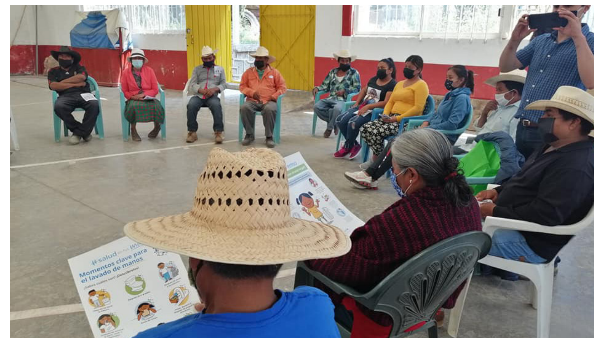
Comunalía, 2024, Fundación Comunitaria Puebla

Igualmente, el alcance geográfico de la iniciativa varió entre fundaciones. La Fundación Punta de Mita priorizó tres comunidades de su área geográfica de intervención (Emiliano Zapata, Corral del Risco e Higuera Blanca), la Fundación Merced Querétaro