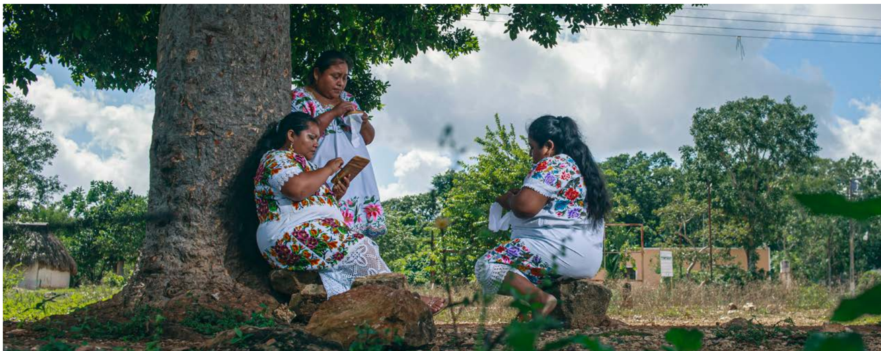
Ensamble Artesano, 2023, Fundación Legorreta Hernández 2