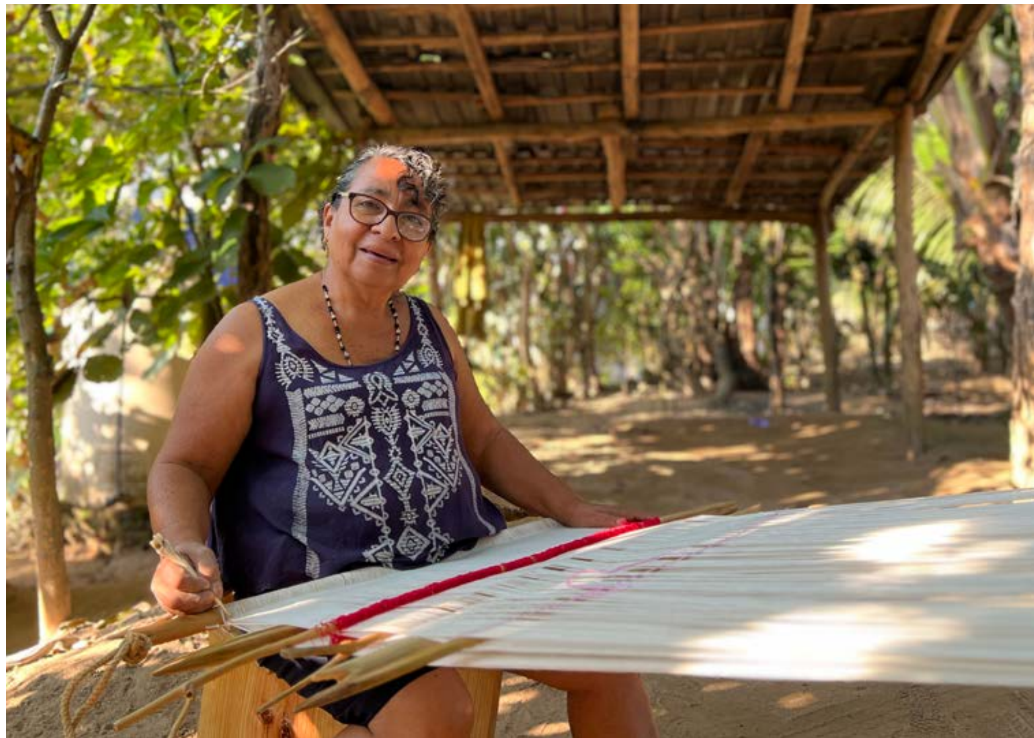
Ensamble Artesano, 2023, Tuux Mexikoo 1

El propósito central del Modelo de Desarrollo Integral Comunitario es desarrollar estrategias para que las personas