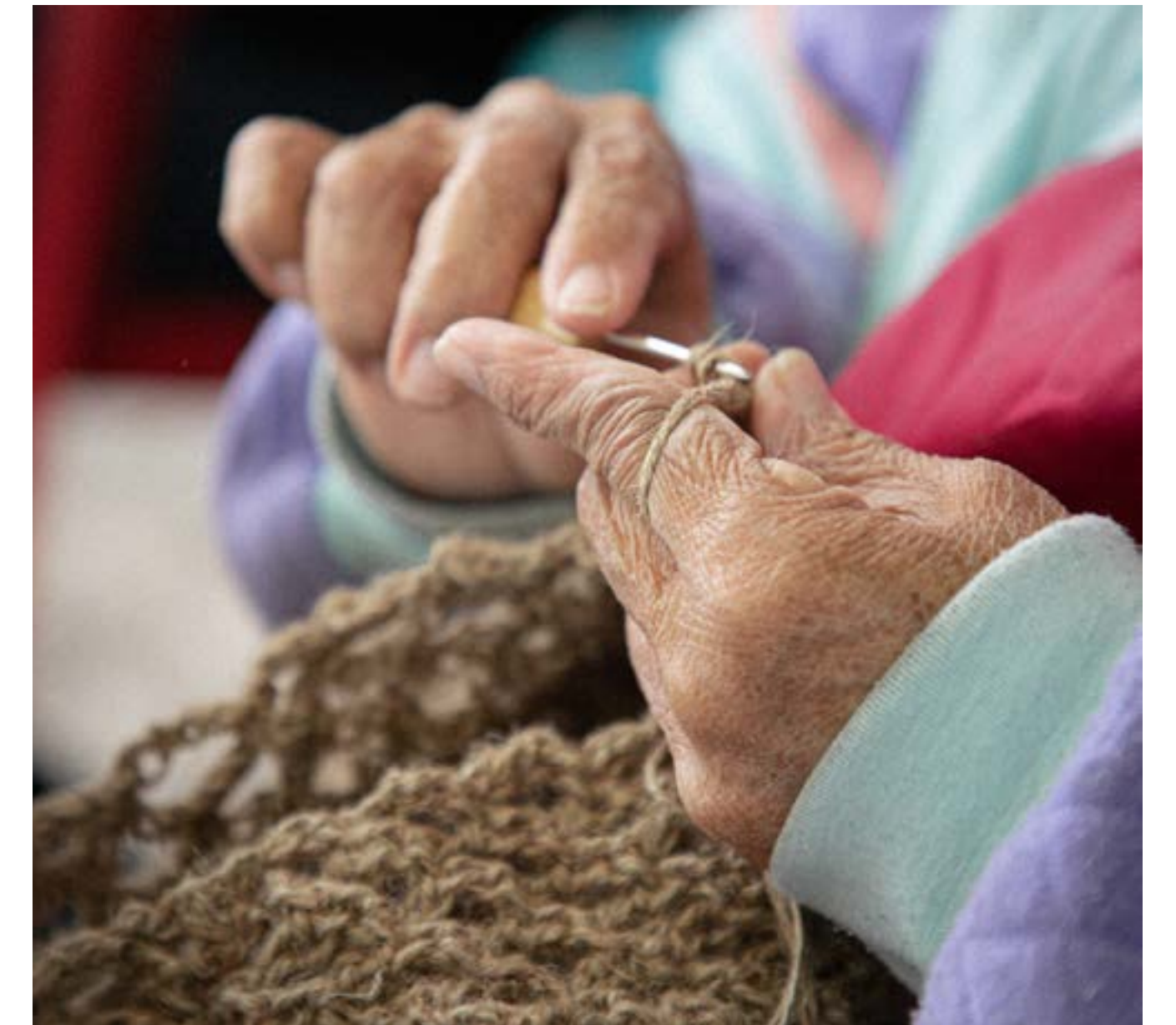
Ensamble Artesano, 2023, Caralarga