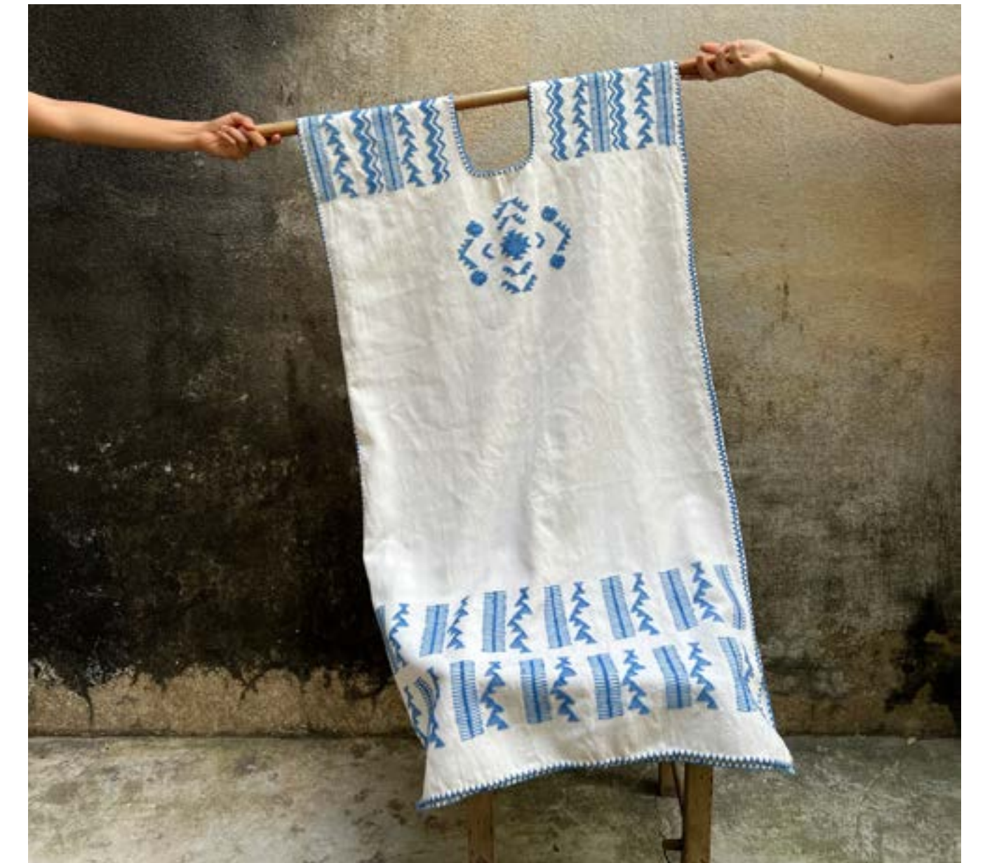
Ensamble Artesano, 2023, Tuux Mexikoo 3

Estas piezas permiten ampliar las posibilidades de acceso a diferentes mercados y generan información valiosa sobre el comportamiento del mercado que se puede compartir con los GA y las OA. En este sentido, el laboratorio