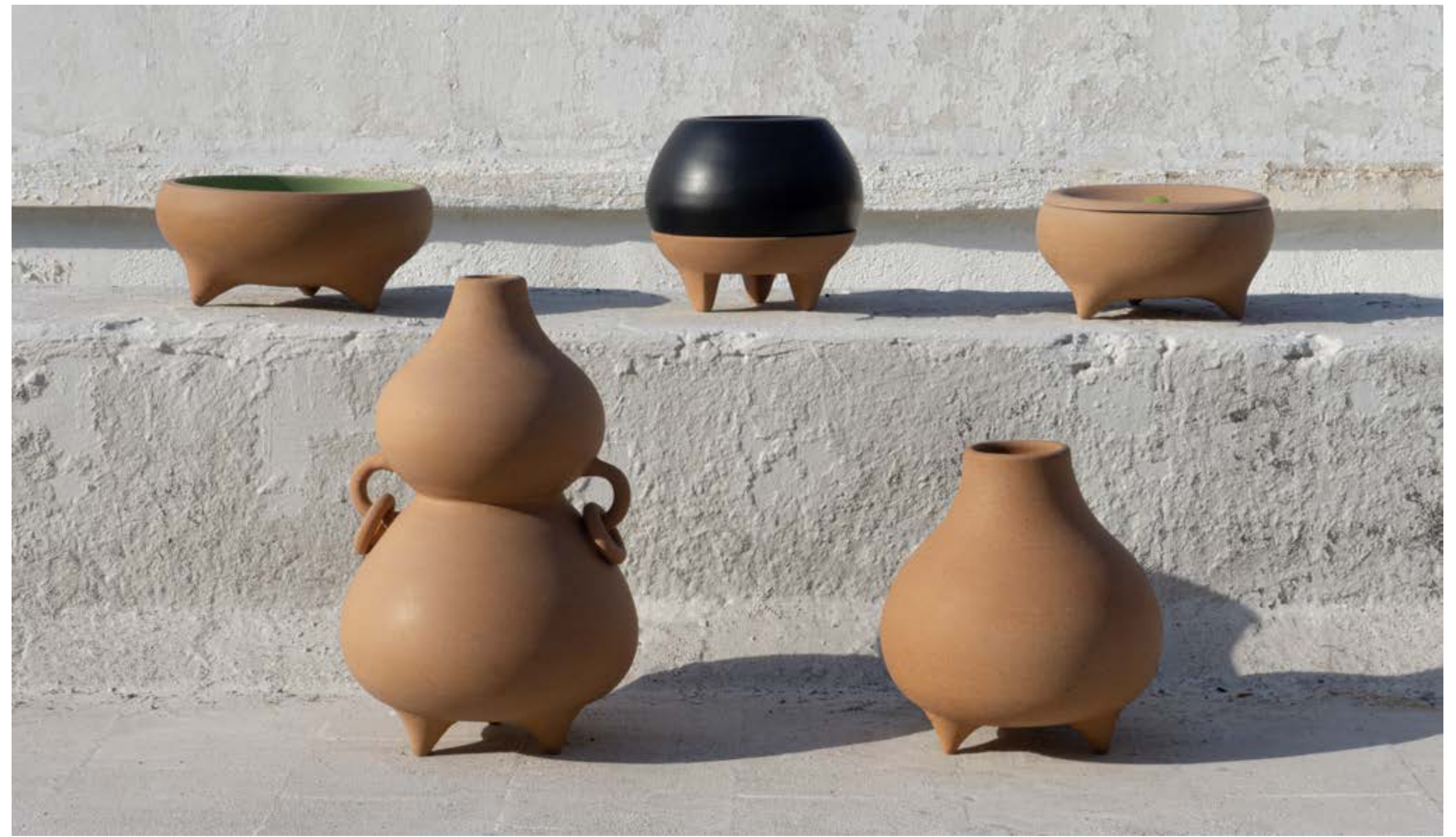
Ensamble Artesano, 2023, Raíz Mx

Por su parte, Traspatio Maya es una marca colectiva que representa a productores rurales de agrobiodiversidad de la península de Yucatán que se dedican a la producción sostenible de frutas, vegetales, sal, miel y maíces criollos del sistema de milpa. En su calidad de plataforma de comercialización para las personas productoras, busca fortalecer la participación en la cadena de valor de sus productos, garantizar su acceso a un mercado diferenciado en términos de comercio justo y generar una “cadena de valor que vincule al productor con un mercado diferenciado que valora la agricultura y reconoce la labor de los productores