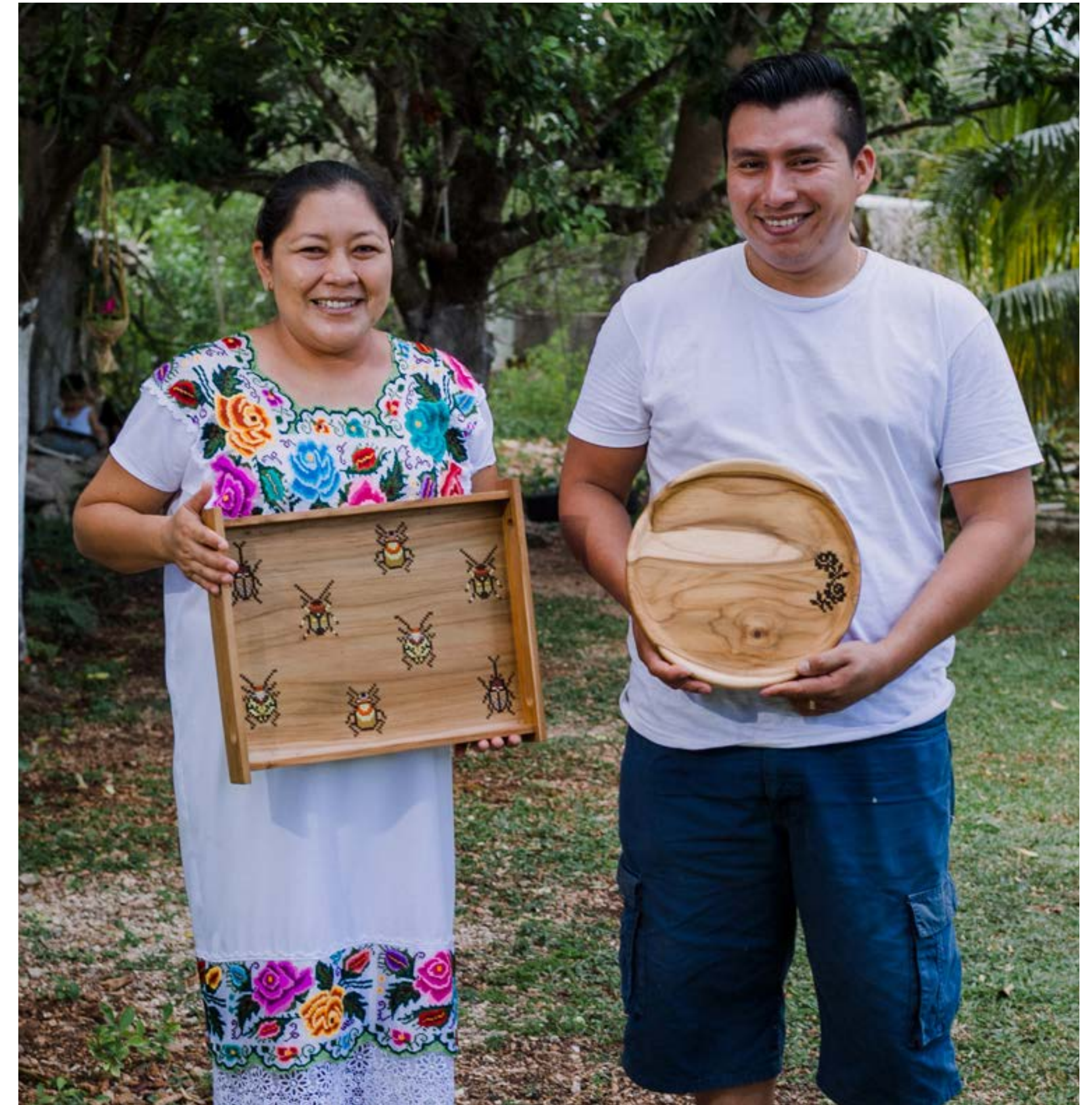
Ensamble Artesano, 2023, Fundación Legorreta Hernández 1