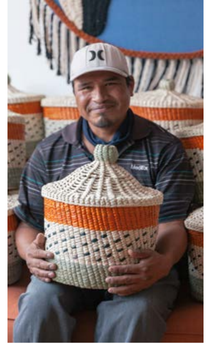
Ensamble Artesano, 2023, M.A. Estudio 3

El aprendizaje colaborativo y la construcción colectiva están en el centro de la dinámica de Ensamble Artesano. Las orientaciones estratégicas de la plataforma (el manifiesto de la red, la visión, la misión y la teoría de cambio), los principales criterios de operación (relativos al costeo, el precio justo, la comercialización y comunicación), el sistema de seguimiento (los tableros de información sobre el alcance, el seguimiento de las ventas y el fortalecimiento) y los procesos de diseño participativo para la producción de las colecciones han sido fruto de la colaboración y el intercambio de buenas prácticas. Estos procesos colaborativos han generado los resultados esperados (orientaciones, criterios, herramientas y productos) y, a la vez, profundizado el capital social y la confianza entre las personas