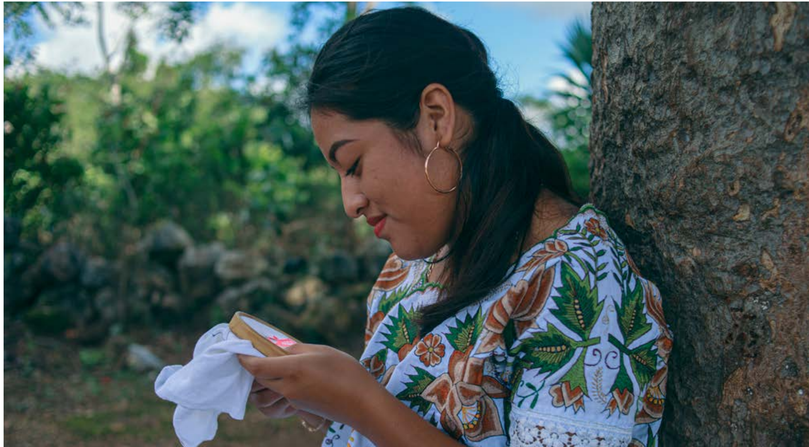
Ensamble Artesano, 2023, Fundación Legorreta Hernández 3

participantes. Es así que este círculo virtuoso ha impulsado la evolución de Ensamble Artesano.