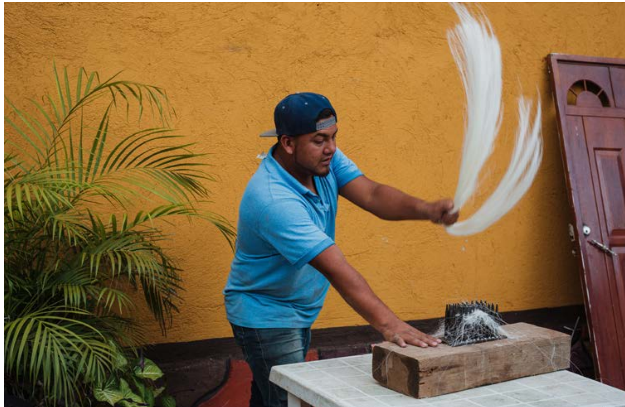
Ensamble Artesano, 2023, Hermano Maguey

en el manifiesto. 23 Ese conjunto de elementos, elaborados de manera colaborativa durante el encuentro entre pares (a saber, las prioridades del fortalecimiento, las orientaciones para realizarlo y el manifiesto), sentaron las bases para una agenda de fortalecimiento que permita avanzar en un proceso de mayor integración de artesanas y artesanos a la red.