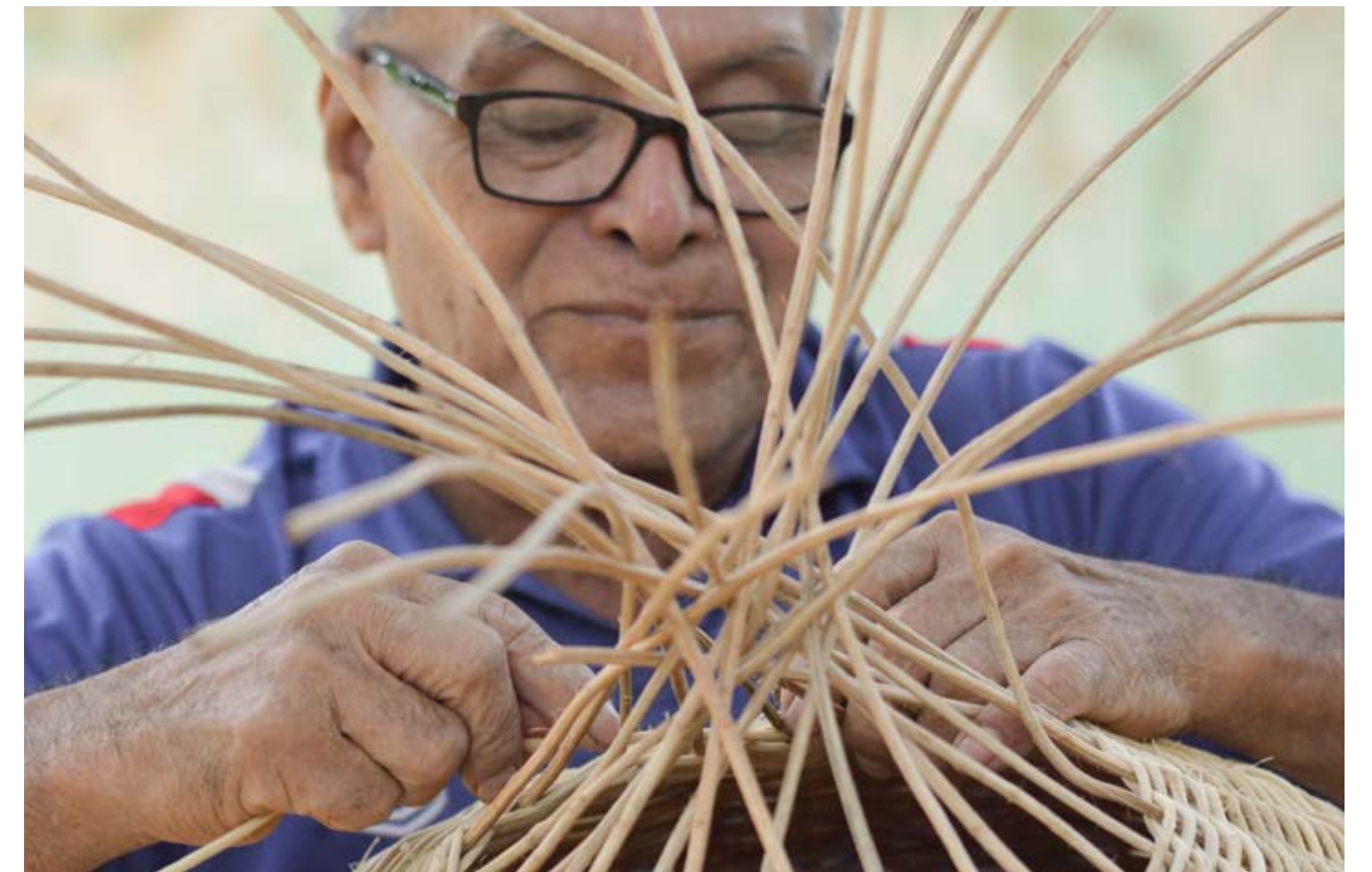
Ensamble Artesano, 2023, Zerete

ella se enfatiza no solo el trabajo dirigido hacia este sector, sino también aquel que se realiza con los y las artesanas. El objetivo es fortalecer los liderazgos compartidos e incrementar los intercambios de prácticas y su participación en los espacios de decisión de la red. En ese sentido, no solo se profundizan la inclusión, el poder compartido y la ampliación de los espacios para escuchar las voces de los y las artesanas; también se sientan las bases para que los grupos artesanales se apropien del proyecto de Ensamble Artesano y aumente el impacto y la sostenibilidad de la plataforma.