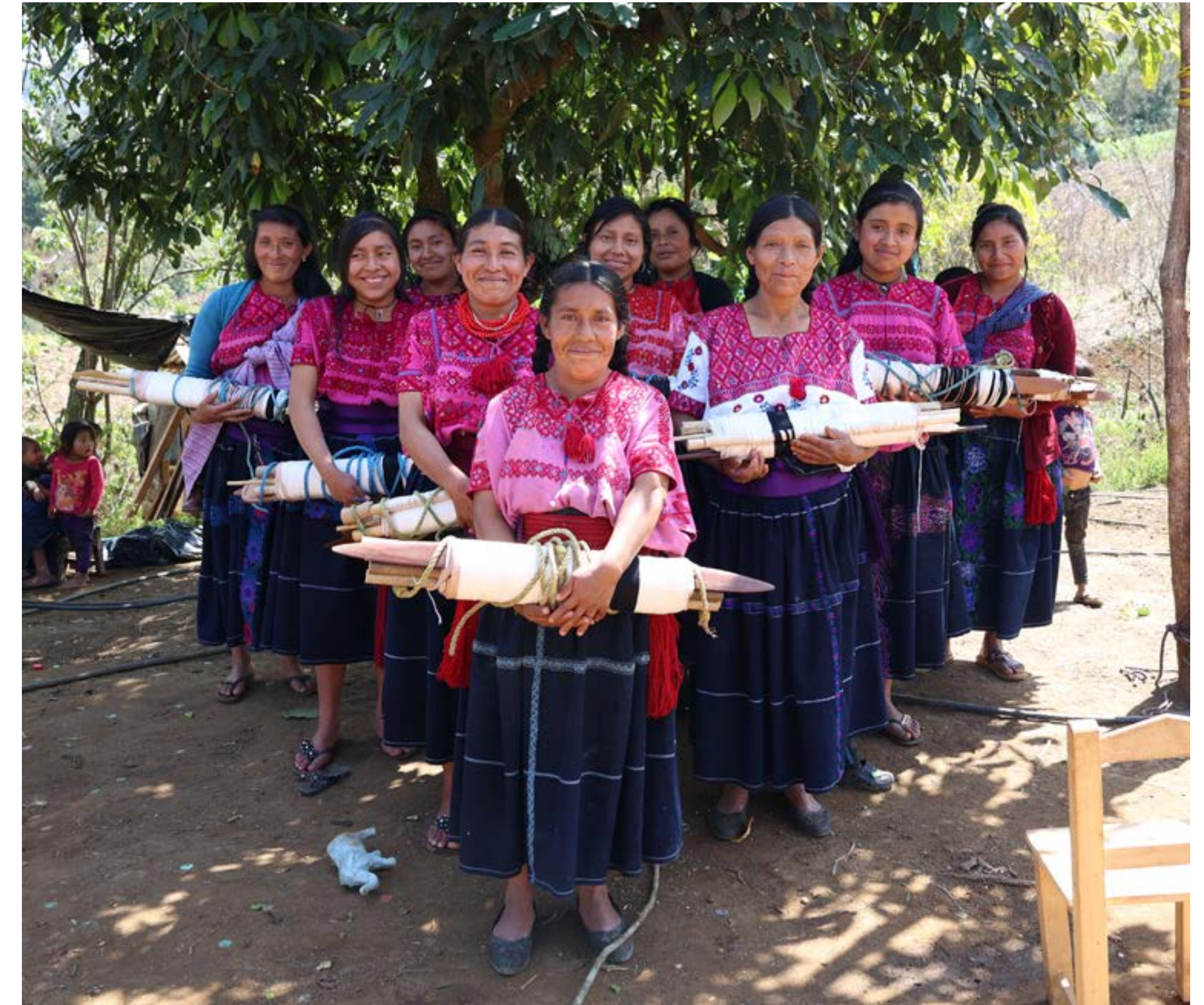
Ensamble Artesano, 2023, NGO IMPACTO 1

diario de actores que sueñan y construyen mejores formas... y que no lo construyen unos cuantos, sino todos los que formamos parte. (Ensamble Artesano, 2023) 2