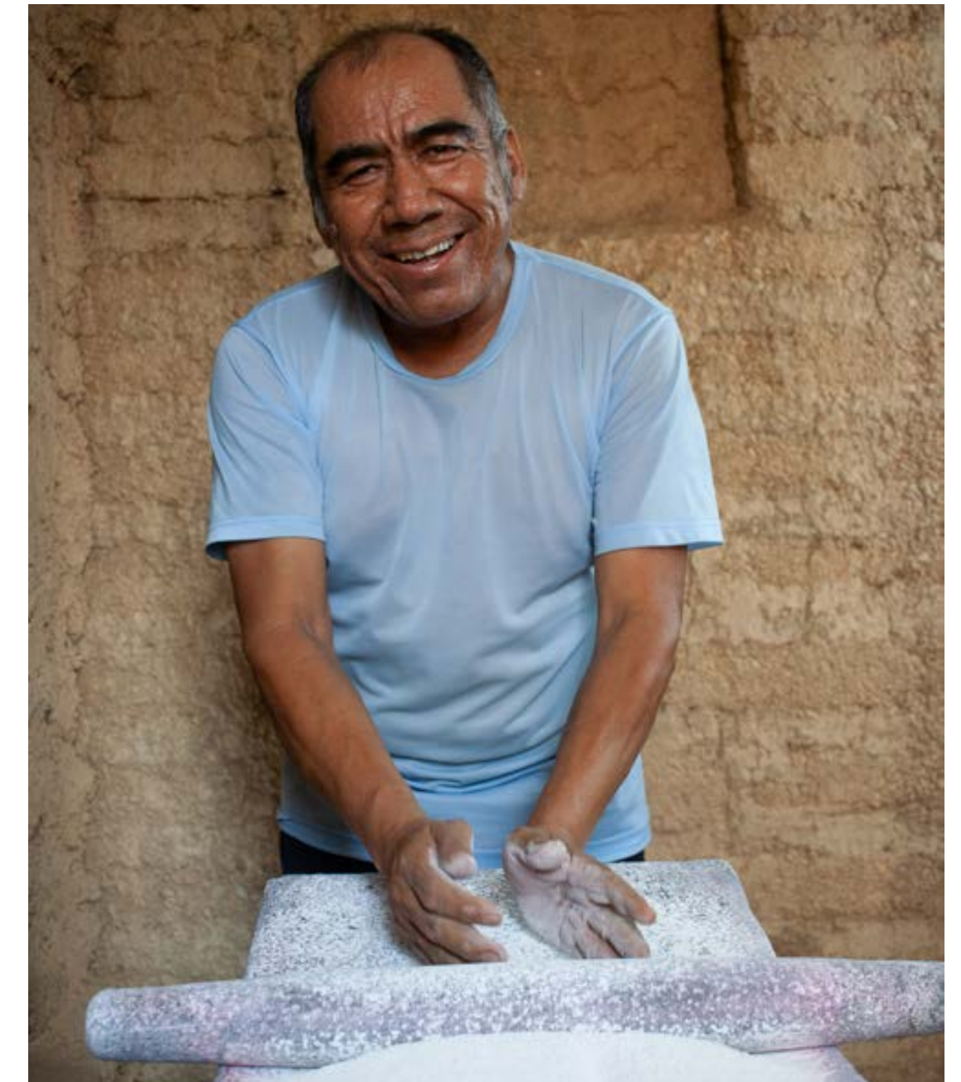
Ensamble Artesano, 2023, Alicia D' Core

enfrentar sus propios desafíos. De ahí que la identificación y el intercambio de buenas prácticas se convierta en un criterio central para el fortalecimiento de la plataforma, o como se menciona en un documento relacionado, “las buenas prácticas