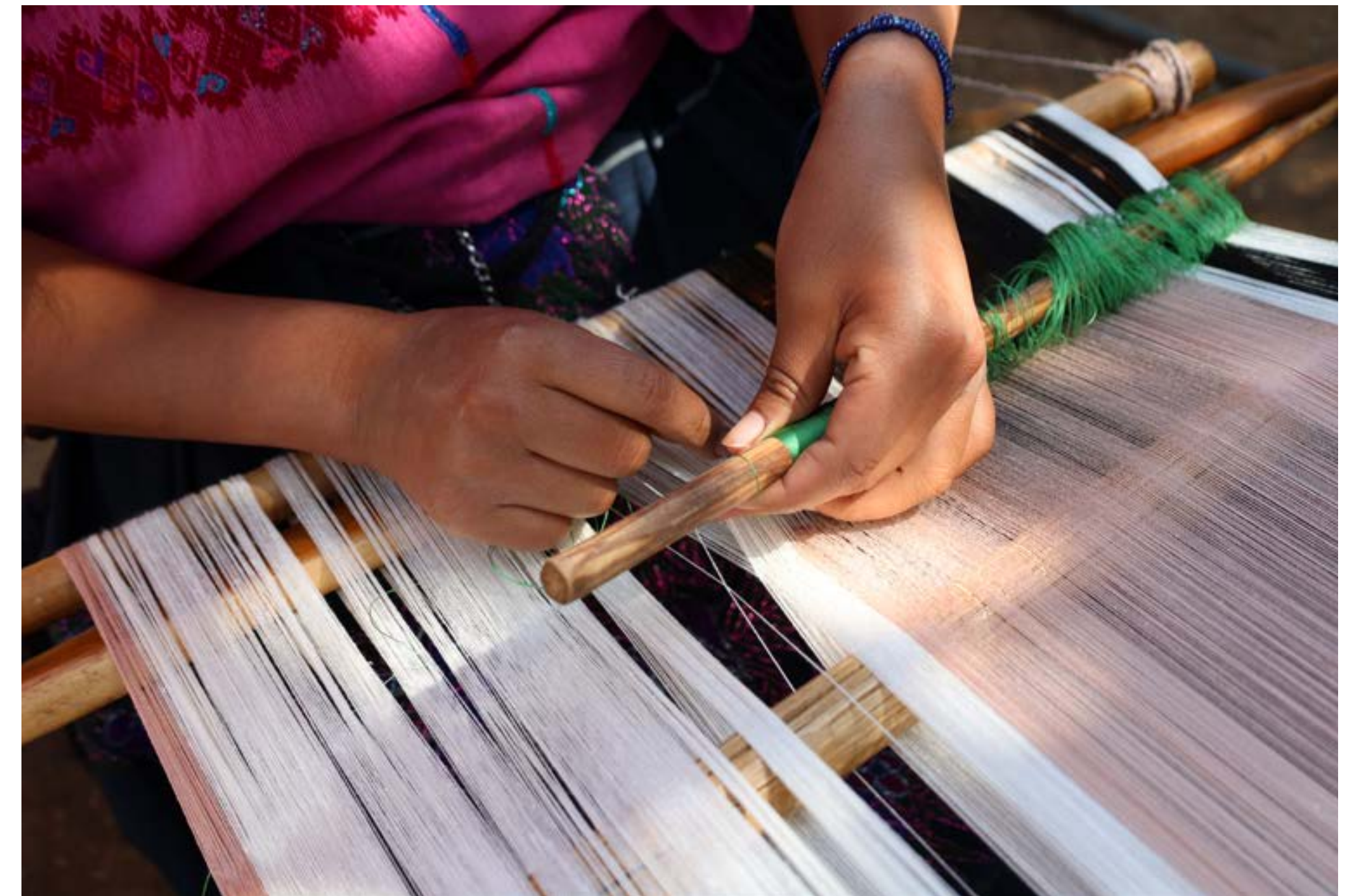
Ensamble Artesano, 2023, NGO IMPACTO 6

tar la crisis y poner el foco en la reactivación económica de los grupos artesanales, siguió una fase de consolidación y reflexión sobre las estrategias orientadas al desarrollo de liderazgos colaborativos y una mayor integración de los grupos artesanos a la dinámica de la red. El encuentro entre pares se llevó a cabo el 5 y 6 de diciembre del 2022 en San Cristóbal de las Casas, Chiapas, y fue diseñado por la propia red de Ensamble Artesano y acompañado por el PNUD. Este encuentro ilustra tanto el proceso que permitió avanzar en la nueva fase, como la forma