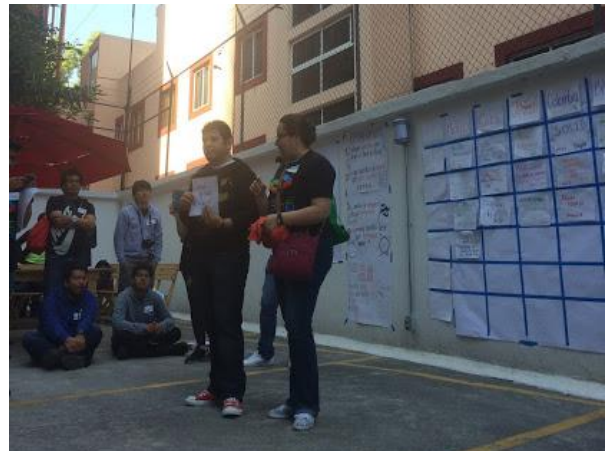
Momentos del Marketplace para crear la agenda