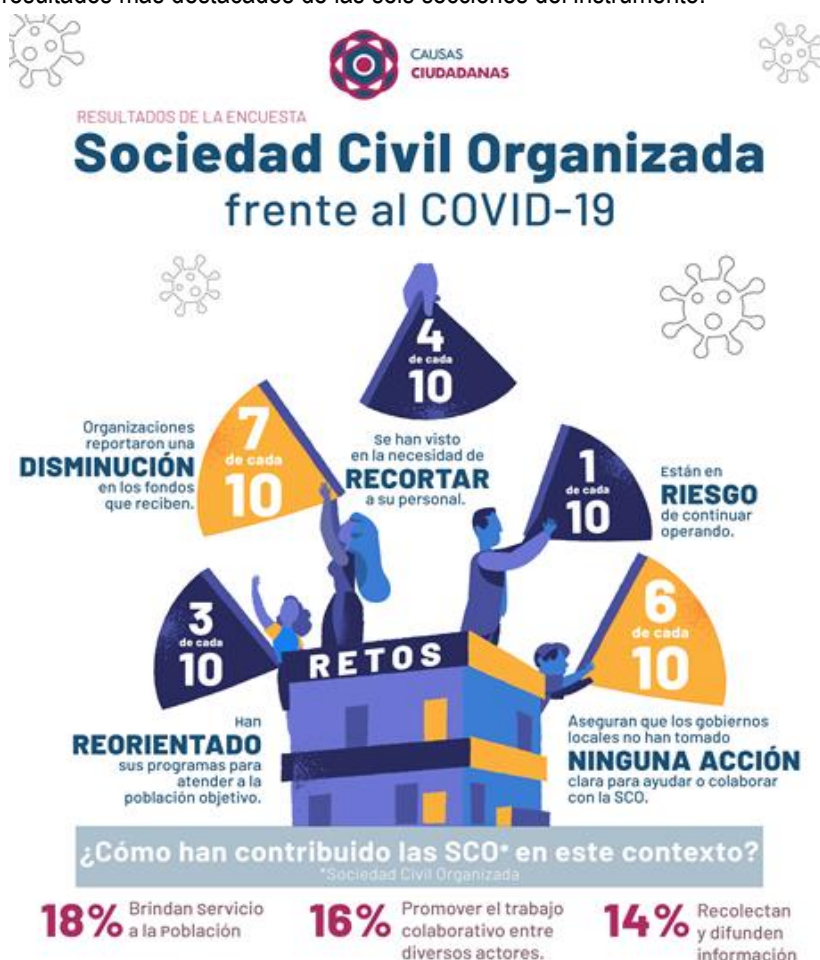
Ilustración 1: Infografía elaborada por ¿Cómo vamos? Colima, enlace estatal de Causas Ciudadanas por el estado de Colima

A continuación, mostramos una infografía que resume los resultados principales de la encuesta y más adelante, presentamos los resultados más destacados de las seis secciones del instrumento.